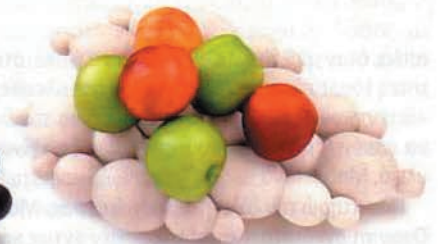
Πάνω: Υpsilon . Καλόγερος από πλέξι-γκλας και ξύλο. Σχεδιαστής: Θανάσιος Μπάμπης