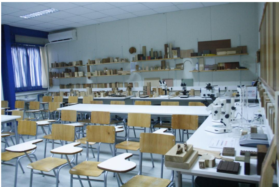
Άποψη εργαστηρίου του Τμήματος (ξενάγηση - ενημέρωση για τα είδη ξύλου)