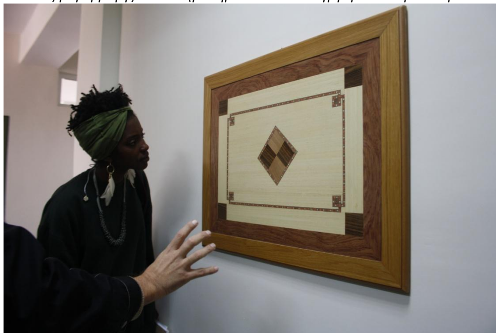
Κατά την ξενάγηση που έγινε στο Τμήμα (παρατήρηση έργου των φοιτητών μας)