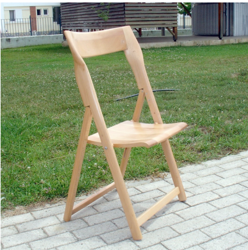
Εικόνα αριστερά: Αναδιπλούμενη ξύλινη καρέκλα του Ιωάννη Μπόθου

Για περισσότερες πληροφορίες και φωτογραφικό υλικό: