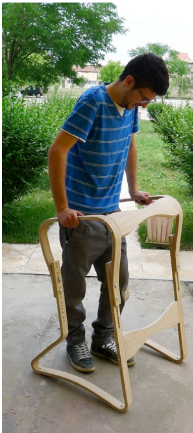
Εικόνα αριστερά: Ξύλινος περιπατητήρας για ανθρώπους με κινητικά προβλήματα των Μ.Κασαπάκη και Θανάση Μπάμπαλη, 2013