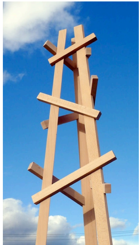
Εικόνα κάτω αριστερά: Ξύλινο πάζλ παιχνίδι για παιδιά της Ε. Κυπραίου και Θανάση Μπάμπαλη