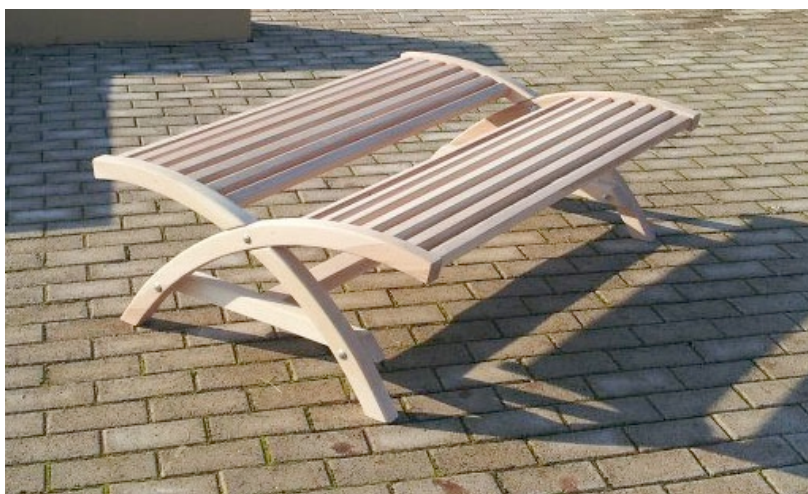
Εικόνα αριστερά: Αναδιπλούμενο - αποσυναρμολογούμενο παγκάκι του Ν. Ερωτοκρίτου και Κ. Τρούσα