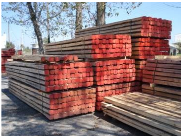
Εικ. 1. Εισαγόμενη μη πιστοποιημένη πελεκητή ξυλεία ερυθρελάτης

Οι εισαγωγείς και έμποροι ξυλείας έχουν την τύχη να χειρίζονται το πιο ζεστό, το πιο όμορφο και οικολογικό προϊόν αειφόρου ανάπτυξης, το ξύλο και κάποια από τα χιλιάδες προϊόντα του. Η δουλειά του Εισαγωγέα και Εμπόρου προϊόντων ξύλου είναι δύσκολη και δεν μπορεί να την ασκεί ο καθένας. Είναι απαραίτητη η συνεχής ενημέρωση γιατί νέα προϊόντα και νέες μέθοδοι εφαρμογής και συντήρησης εμφανίζονται συνεχώς στην αγορά. Όσοι εισάγουν και διαθέτουν στην αγορά προϊόντα ξύλου οφείλουν να γνωρίζουν την πλήρη ταυτότητα των προϊόντων αυτών δηλ. τις ιδιότητες, τα πλεονεκτήματα – μειονεκτήματα, τους χειρισμούς συντήρησης και βαφής, τις βασικές τεχνικές εφαρμογής των προϊόντων αυτών. Κλείνοντας θα επισημάνω την ανάγκη της διαρκούς ενημέρωσης και μάθησης. Το Τμήμα Σχεδιασμού και Τεχνολογίας Ξύλου και Επίπλου, με το προσωπικό και τις εγκαταστάσεις του είναι ο κατάλληλος φορέας για το σκοπό αυτό. Νομίζω ότι μια σειρά σεμιναρίων ενημέρωσης επάνω σε όλα αυτά μπορεί να αναλάβει το Τμήμα μας, συμβάλλοντας έτσι στην σωστή οργάνωση της αγοράς των προϊόντων ξύλου. Τέλος κρίνω εξίσου σημαντικό να επισημάνω την ανάγκη της στελέχωσης των επιχειρήσεων εισαγωγής και εμπορίας με αποφοίτους μας, οι οποίοι αποκτούν τεχνολογική παιδεία υψηλού επιπέδου, γιατί έχουν την ευκαιρία να φοιτούν σε ένα οργανωμένο και πρότυπο Τμήμα ΤΕΙ με πλήρη στελέχωση και υλικοτεχνική υποδομή.