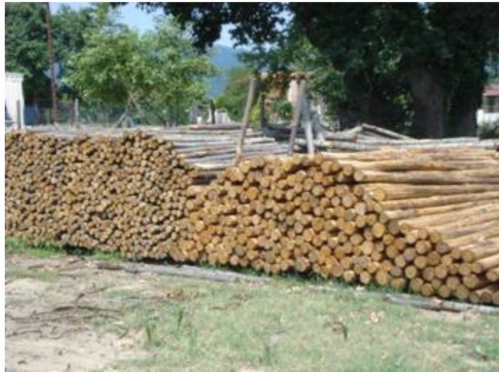
Εικ. 2. Πελεκητή ξυλεία και πάσσαλοι καστανιάς ελληνικής προέλευσης και άριστης ποιότητας