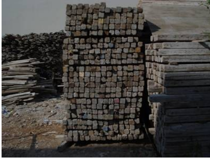
Εικ. 4. Ακατάλληλη εισαγόμενη ξυλεία ξυλοτόπων από ερυθρελάτη