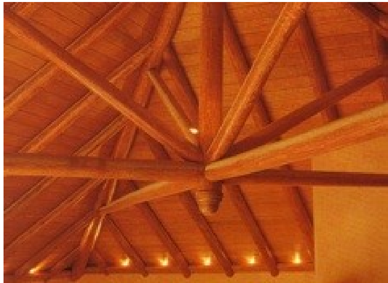
Εικ. 6. Εντυπωσιακή εφαρμογή ξύλου ελληνικού κυπαρισσιού, του καλύτερου δομικού προϊόντος ξύλου (Κατασκευή: κ. Σαλταπίδας Χρήστος)