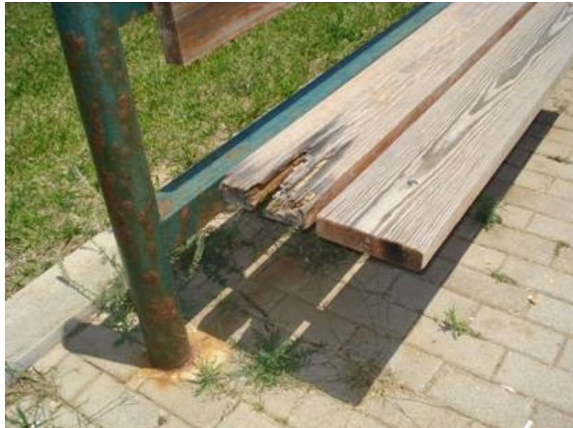
Εικ. 3. Αστοχίες ξύλινων κατασκευών υπαίθρου Τοπικής αυτοδιοίκησης