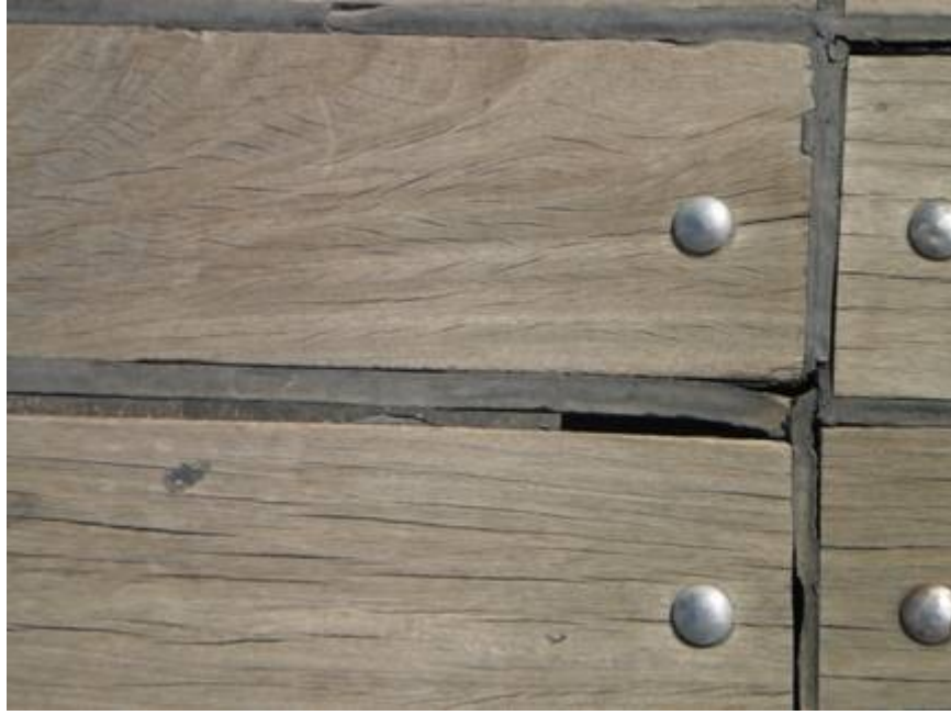
Εικ. 5. Αστοχία τοποθέτησης ξύλινων στοιχείων από Ιρε, με μεγάλα κενά μεταξύ τους στην πεζογέφυρα Κατεχάκη