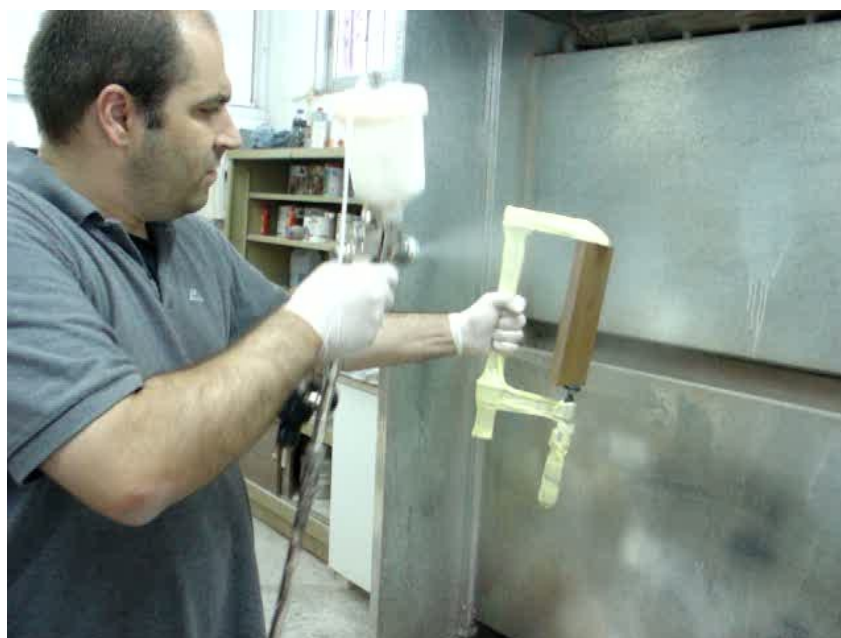
Εικόνα 1: Επικάλυψη δοκιμών από τεχνικό της Sayerlack

Σε ότι αφορά στην πειραματική διαδικασία που ακολουθήθηκε: δείγματα συμπαγούς ξύλου μαύρης πεύκης ( Pinus nigra L. ) επικαλύφθηκαν με διάφορα επικαλυπτικά συστήματα της εταιρείας Sayerlack A.E., ενώ για λόγους σύγκρισης δοκιμάστηκαν δείγματα ξύλου χωρίς επικάλυψη. Η εφαρμογή των επικαλυπτικών συστημάτων πραγματοποιήθηκε στο Εργαστήριο Φινιρίσματος από τεχνικό της Sayerlack ο οποίος μετέβη στο ΤΕΙ της Καρδίτσας για αυτή τη συνεργασία.