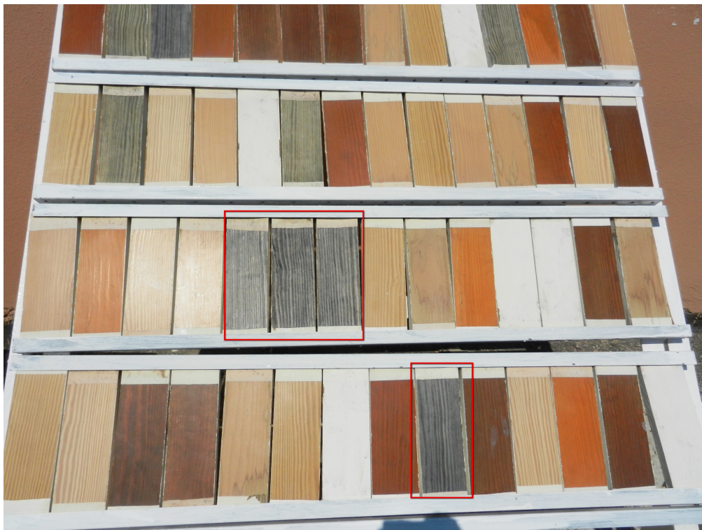
Εικόνα 3: Δοκίμια μετά το πέρας των 12 μηνών γήρανσης (σε κόκκινο πλαίσιο δοκίμια χωρίς επικάλυψη)