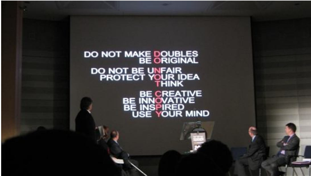
Στιγμιότυπο από το Animation της συμμετοχής.