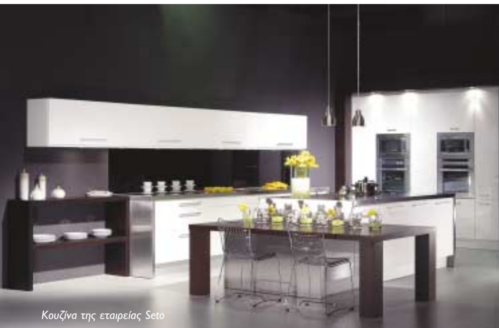
Κουζίνα της εταιρείας Seto

κοί, οικονομικοί και δημογραφικοί παράγοντες που επηρεάζουν τη ζήτηση των προϊόντων.