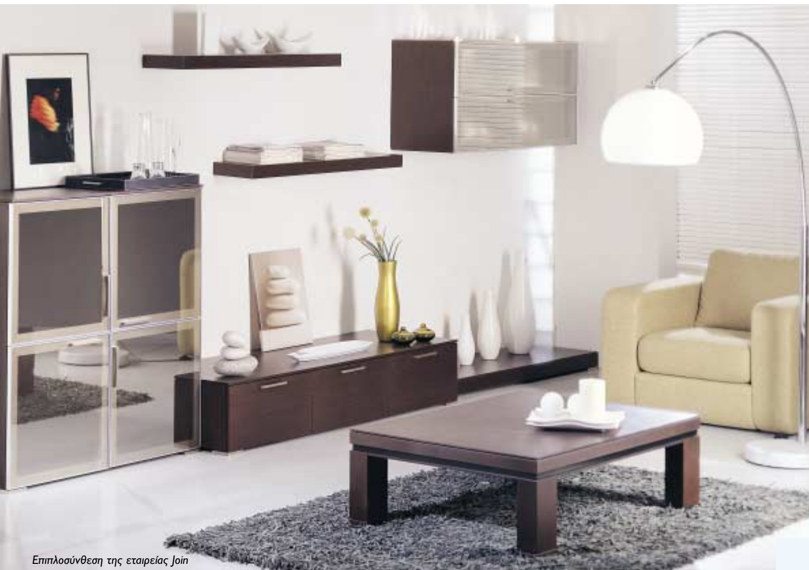
Επιπλοσύνθεση της εταιρείας Join

Ποιες είναι οι πληροφορίες που μπορεί να συλλέξει μια επιχείρηση επίπλου μέσα από μια εμπειριστατωμένη έρευνα αγοράς και ποια τα οφέλη που μπορεί να αποκομίσει από τη χρήση της;