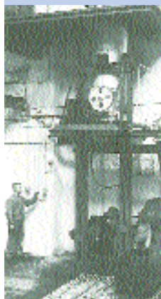
Παραγωγή ινών με το φημισμένο 'Mason canon'

Στην υγρή μέθοδο παραγωγής της σκληρής ινοπλάκας, οι ίνες περνούσαν μέσα από κόσκινα σε μορφή αιωρήματος ινών. Το 1914, η εταιρία Leikam-Josephstal AG στη Βιέννη είχε την ιδέα να στρωματώσει τις ίνες με τη βοήθεια του αέρα. Ωστόσο, η ιδέα του πρωτοπόρου Weyerhaeuser στις ΗΠΑ στάθηκε τότε φανταστική, αφού ήταν ο πρώτος που ανέπτυξε την "ημι-ξηρή" μέθοδο (semi-dry