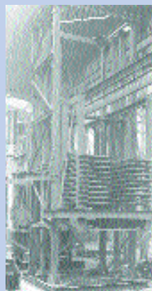
Πρωταρχικός τύπος θερμής πρέσας συμπίεσης

process) το 1943, καθοδηγούμενος από το ερευνητικό ινστιτούτο Plywood Research. Το 1951 άρχισε η παραγωγή της ινοπλάκας με την "ημι-ξηρή" μέθοδο από τη βιομηχανική εταιρία Anacores Veneer. Κατά την "ημι-ξηρή" μέθοδο, οι ξυλώδεις ίνες προτού συμπιεστούν είχαν μία μέση υγρασία 20-35%.