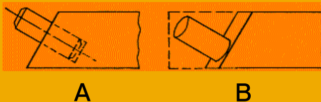
Σχήμα 9. Τρόπος εισαγωγής καβίλιας A Μόρσο B