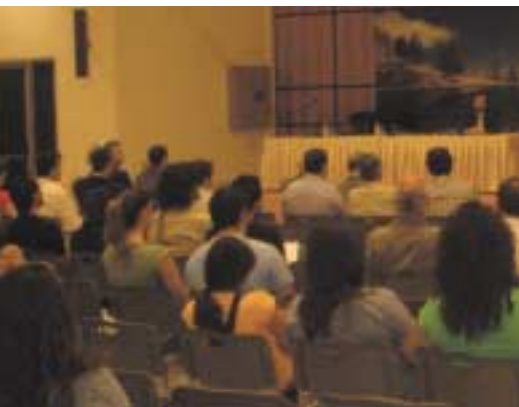
Άποψη του κοινού

εντυπωσίασε τους παρευρισκομένους. Στο δεύτερο μέρος της ημερίδας το λόγο πήρε ο Δρ. Νταλός, Επίκουρος καθηγητής Τ.Ε.Ι Λάρισας, κάνοντας αναφορά στη συμβολή του K-Cluster στον τομέα του ξύλου στην Μακεδονία. Επίσης, παρουσίασε τις φάσεις υλοποίησης του προγράμματος "Ανάπτυξη νέων προϊόντων ή και διαδικα-